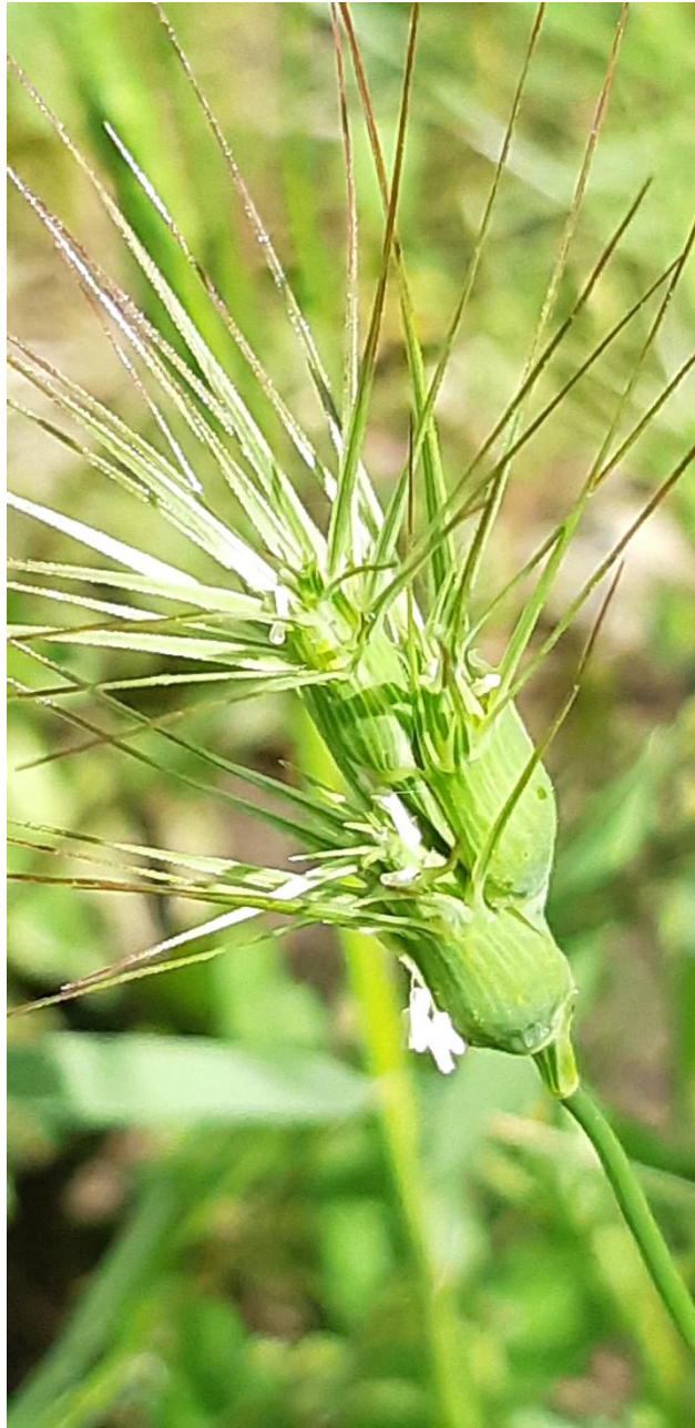
Aegilops Ovata i blomst