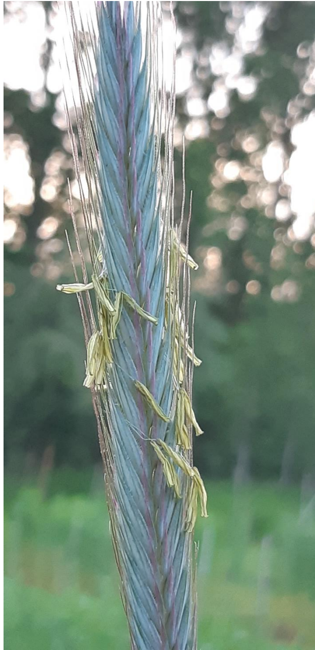
Schmidt Rugen blomstrer over 3 trin med start midt på akset