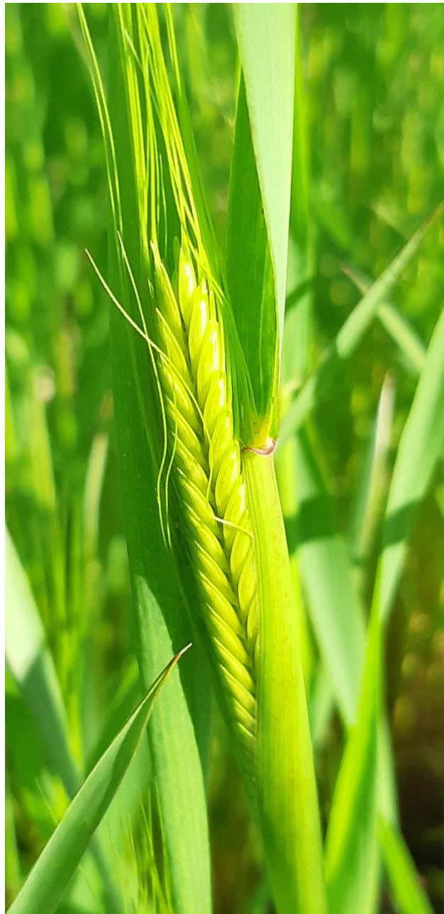
Enkorn skrider frem

Iagttagelse af Enkorn: Vild Enkorn, Sort Enkorn, Rød Enkorn, Hvid Enkorn og den Solgule Søtofte Enkorn - Enkorn plantens særlige forbindelse til Nervesystemet