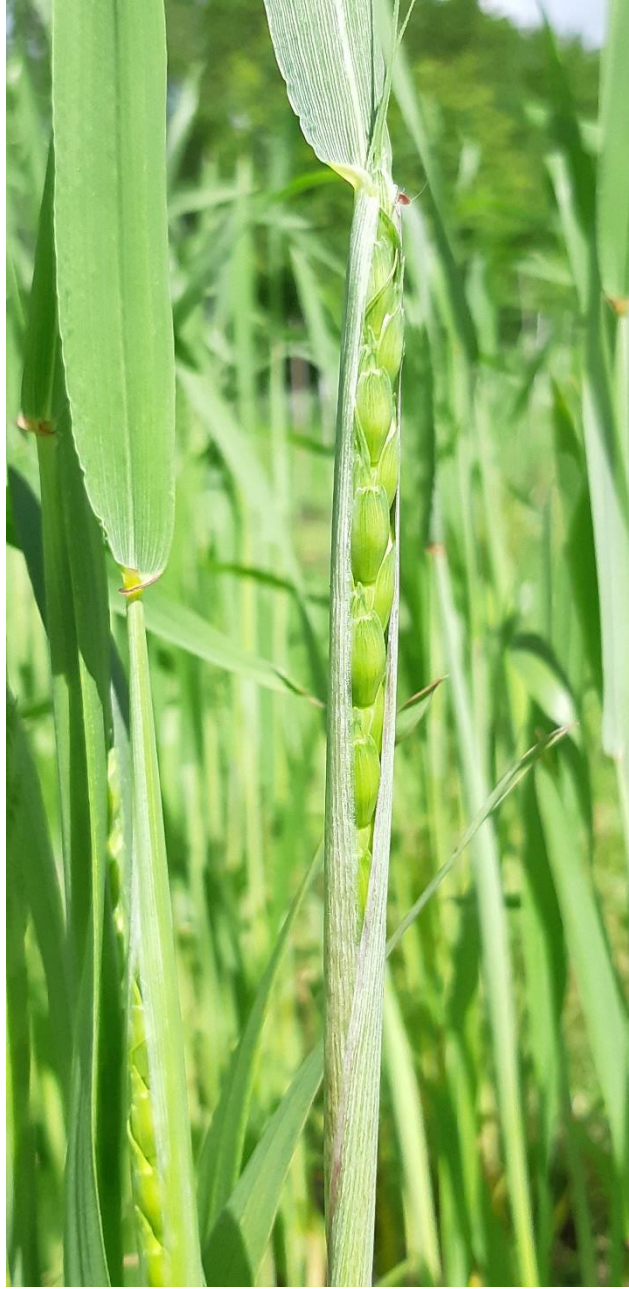
Spelten med ler skrider igennem bladhinden