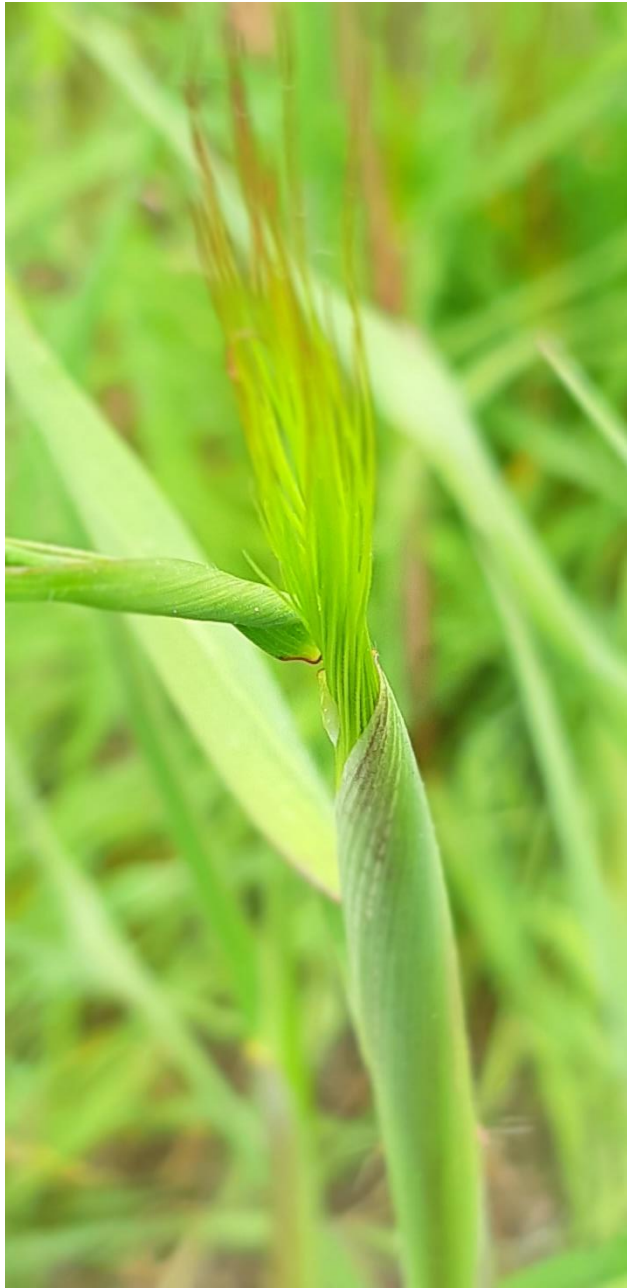
Vild Byg snor sig med sine opdriftskræfter