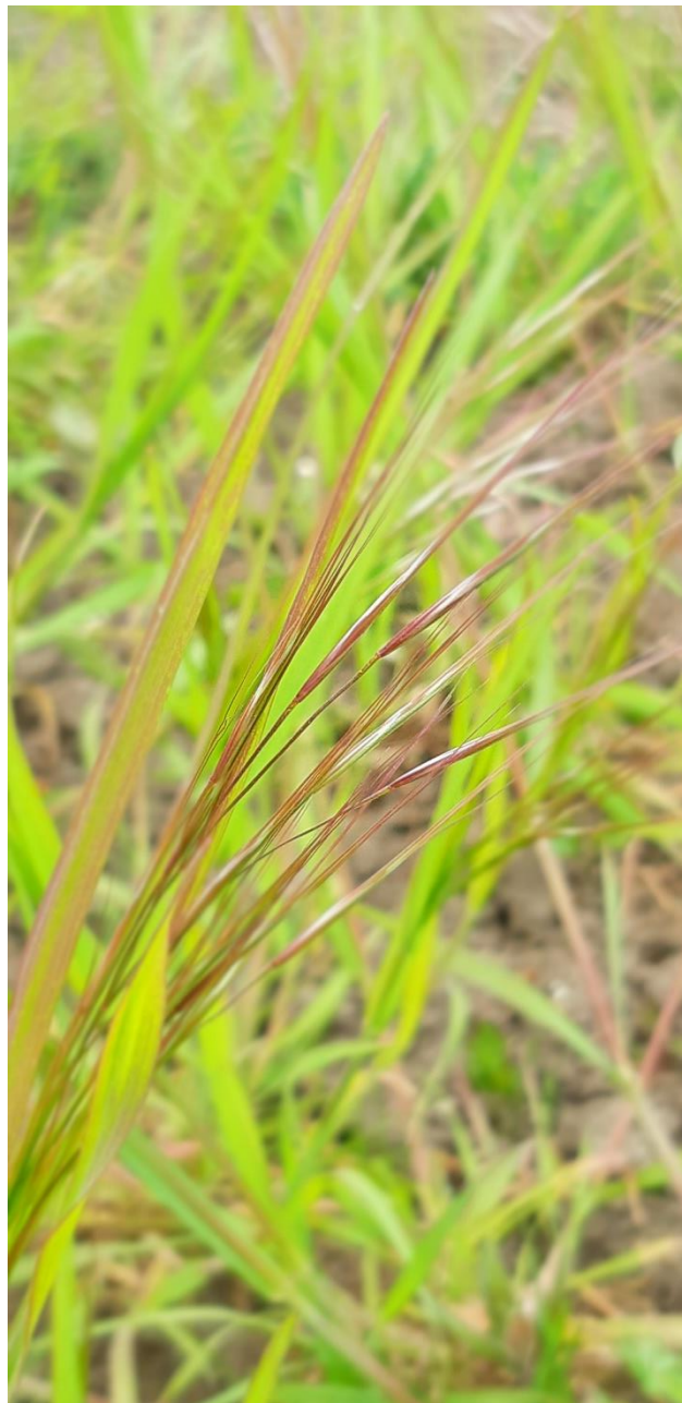
Vild Havre, unge aks

lagttagelse af farver og former på udvalgte græsser – Vild Havre, Vild Byg, Vild Hvede og Dasypyrum Rug.