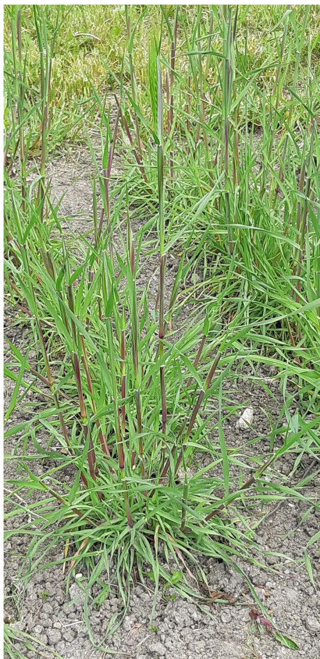
Dasypyrum Rug med lilla farver på halmen

Iagttagelse af Rug: Biodynamisk udviklet Schmidt Rug og Dasypyrum rugen , Spelt m. Ler, Belivede mineraler, Kaliumsalte og Leveren.